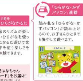
「ひらがな・かずパソコン」運動 読み札を「ひらがな・かずパソコン」が読み上げるので、お子さんひとりで集中して遊べます。