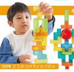
10月号 どうぶつバランスパズル