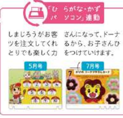
「ひらがな・かずパソコン」運動 しましまがお客さんになって、ドーナツを注文してくれどりでも楽しく力をつけていきます。

しましまの チョコドーナツを 3個ください! トッピングで 種類が増える ことで、条件の 難しさがアップ! 仲間分けが もっと楽しく なります。