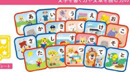
11月号 ひらがなかるた 音のリズムが楽しいひらがなを使ったかるた遊びで文字を使う楽しさを体験できます。