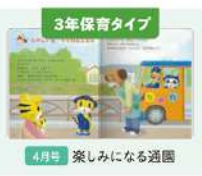
3年保育タイプ 4月号 楽し気になる週園