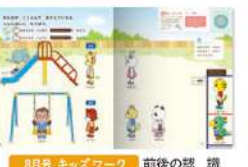
8月号 キッズワーク 前後の認識