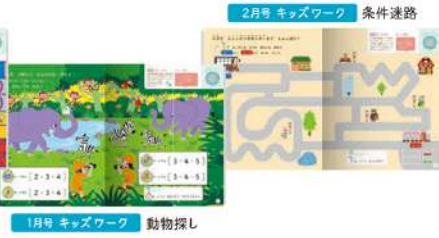
2月号 キッズワーク 条件迷路