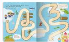
12月号 えんぴつワーク