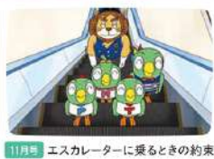
11月号 エスカレーターに乗るときの約束

年間を取り組む 主なテーマ ● 月ごとの約束 ● 公園で遊ぶときの約束 ● 水辺での約束 ● 電車に乗るときの約束 ● 病院での約束 など