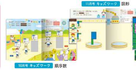
11月号 キッズワーク 図形