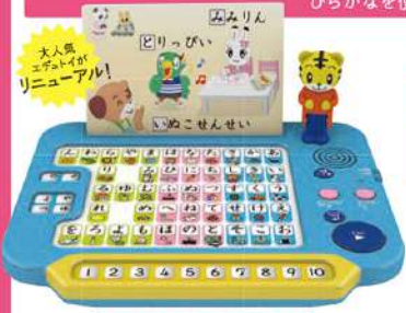
4月号 ひらがな・かずパソコン