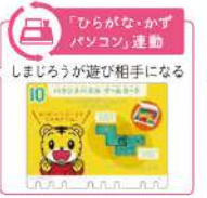
「ひらがな・かずパソコン」運動 しましまが遊び相手になる