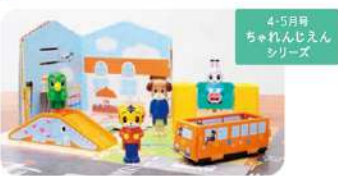
4-5月号 ちゃれんじえんシリーズ