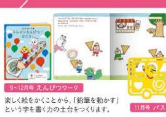
9-12月号 えんぴつワーク 楽しく絵をかくことから、「鉛筆を動かす」という字を書く力の土台をつくります。