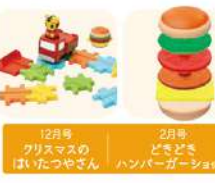
12月号 クリスマスのはいりたつやさん