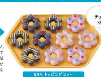
8月号 トッピングセット

しましまの チョコドーナツを 3個ください! トッピングで 種類が増える ことで、条件の 難しさがアップ! 仲間分けが もっと楽しく なります。