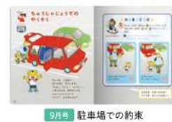
9月号 駐車場の約束