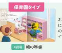
保育園タイプ 4月号 朝の準備