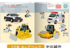
6月号 キッズワーク 欠所補充