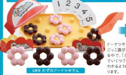
6月号 かずのドーナツやさん