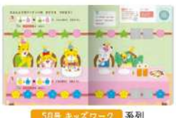
5月号 キッズワーク 系列