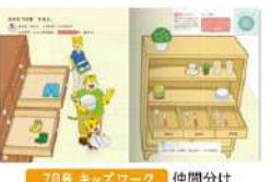
7月号 キッズワーク 仲間分け