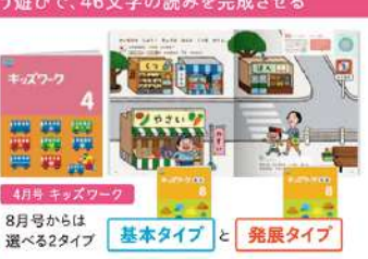
4月号 キッズワーク 8月号からは 選べる2タイプ 基本タイプ と 発展タイプ