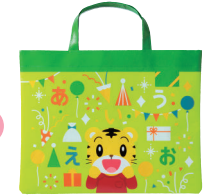
3 スマイルグリーン

※登録がない場合は、こちらで選んだ色の「パソコンかばん」をお届けします。※教材お届け後の変更はできません。